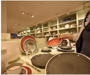
百貨店 La Rinascente