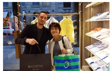
Piazza del Liberty