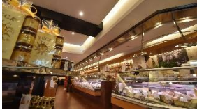
ガラリア Galleria Vittorio Emanuele II