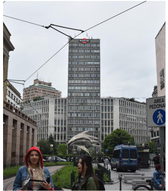
Piazza Armando Diaz