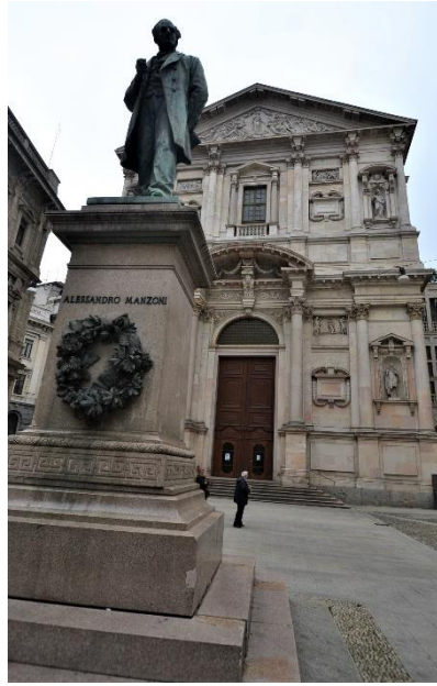
Piazza San Fedele