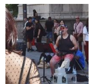
Piazza dei Mercanti

ドゥオーモ広場 100m x 150m。ミラノの都心であり観光客が溢れる。この周辺には、ポルティコが巡る